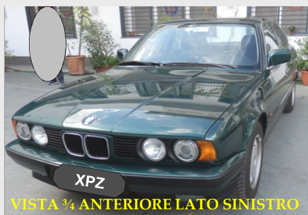
VISTA 3/4 ANTERIORE LATO SINISTRO

Oltre alla documentazione sopraindicata, per ottenere i certificati A.S.I. occorrono le seguenti foto realizzabili da noi presso il Club con € 35,00 di rimborso spese: