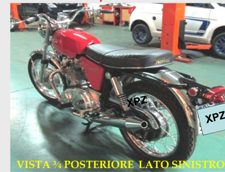
VISTA 3/4 POSTERIORE LATO SINISTRO