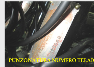
PUNZONATURA NUMERO TELAIO