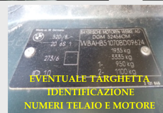
EVENTUALE TARCHETTA IDENTIFICAZIONE NUMERI TELAIO E MOTORE