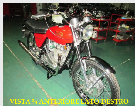
VISTA 3/4 ANTERIORE LATO DESTRO

Oltre alla documentazione sopraindicata, per ottenere i certificati A.S.I. occorrono le seguenti foto realizzabili da noi presso il Club con € 35,00 di rimborso spese: