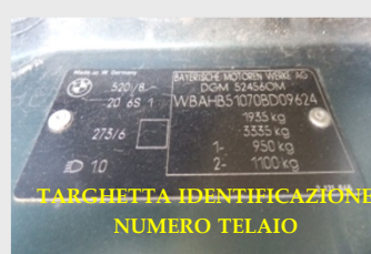
TARCHETTA IDENTIFICAZIONE NUMERO TELAIO

Motoveicoli e Ciclomotori (vanno presentati puliti e in buono stato di carrozzeria e selleria)