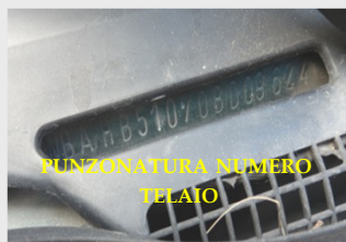
PUNZONATURA NUMERO TELAIO