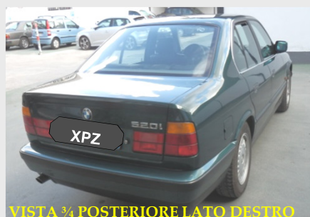
VISTA 3/4 POSTERIORE LATO DESTRO